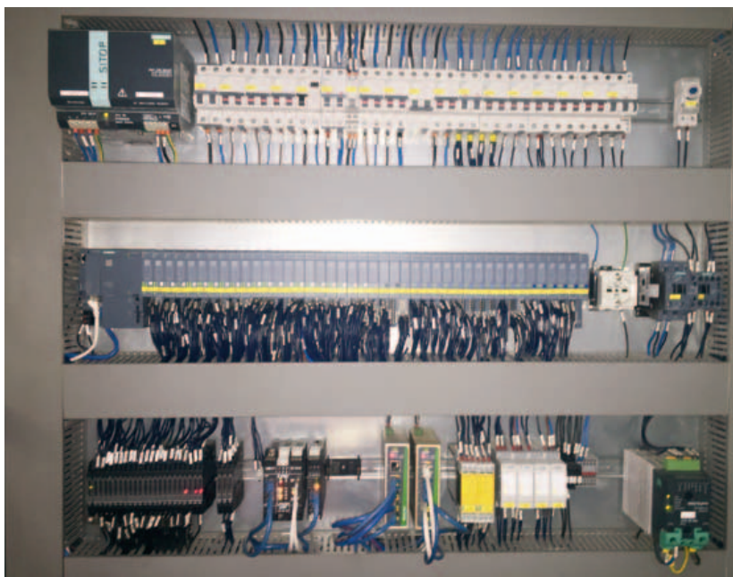
^ Dettaglio del quadro elettrico ausiliario con potenza installata 150 kW per acquisizione segnali, unità di controllo e sistema di connettività remota VPN

Le operazioni di lettura, scrittura e conversione dei parametri di rete elettrica sono gestite da un gateway industriale Modbus – Serial Device Server, Seneca Z-KEY. Un'altra unità Z-KEY gestisce l'acquisizione e la trasmissione via Modbus dei parametri provenienti da un set di regolatori Yokogawa, fondamentali per la gestione dei livelli e delle temperature di processo. I gateway Z-KEY consentono la configurazione rapida di circa 200 tag/variabili di processo tramite template excel oltre a supportare la modalità fail safe configurabile degli I/O. La fornitura Seneca sul lato campo si estende anche alla parte radio con l'installazione del radiomodem Z-AIR operante a 869 MHz per la futura gestione wireless di temperature e set point della caldaia di recupero termico. La scelta della tecnologia di monitoraggio è caduta su LET'S, la piattaforma VPN-IoT di Seneca per macchine e impianti che abbatta i costi di manutenzione, automazione e gestione, offrendo un servizio di connettività su 3 livelli: accesso remoto a macchine impianti, controllo programmabile, supervisione e monitoraggio in rete. Basato sul modulo Server VPN