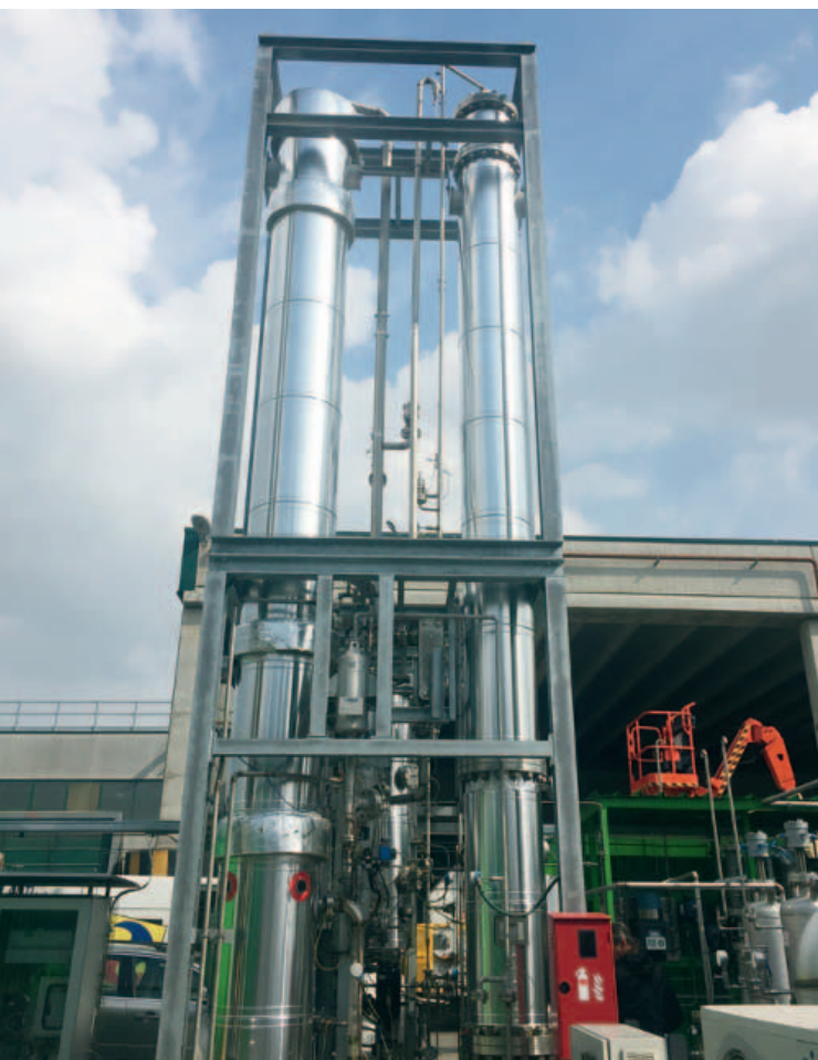
^ Unità di Upgrading GM-GreenMethane da 125 Sm 3 /h di biometano

Le operazioni di lettura, scrittura e conversione dei parametri di rete elettrica sono gestite da un gateway industriale Modbus – Serial Device Server, Seneca Z-KEY. Un'altra unità Z-KEY gestisce l'acquisizione e la trasmissione via Modbus dei parametri provenienti da un set di regolatori Yokogawa, fondamentali per la gestione dei livelli e delle temperature di processo. I gateway Z-KEY consentono la configurazione rapida di circa 200 tag/variabili di processo tramite template excel oltre a supportare la modalità fail safe configurabile degli I/O. La fornitura Seneca sul lato campo si estende anche alla parte radio con l'installazione del radiomodem Z-AIR operante a 869 MHz per la futura gestione wireless di temperature e set point della caldaia di recupero termico. La scelta della tecnologia di monitoraggio è caduta su LET'S, la piattaforma VPN-IoT di Seneca per macchine e impianti che abbatta i costi di manutenzione, automazione e gestione, offrendo un servizio di connettività su 3 livelli: accesso remoto a macchine impianti, controllo programmabile, supervisione e monitoraggio in rete. Basato sul modulo Server VPN